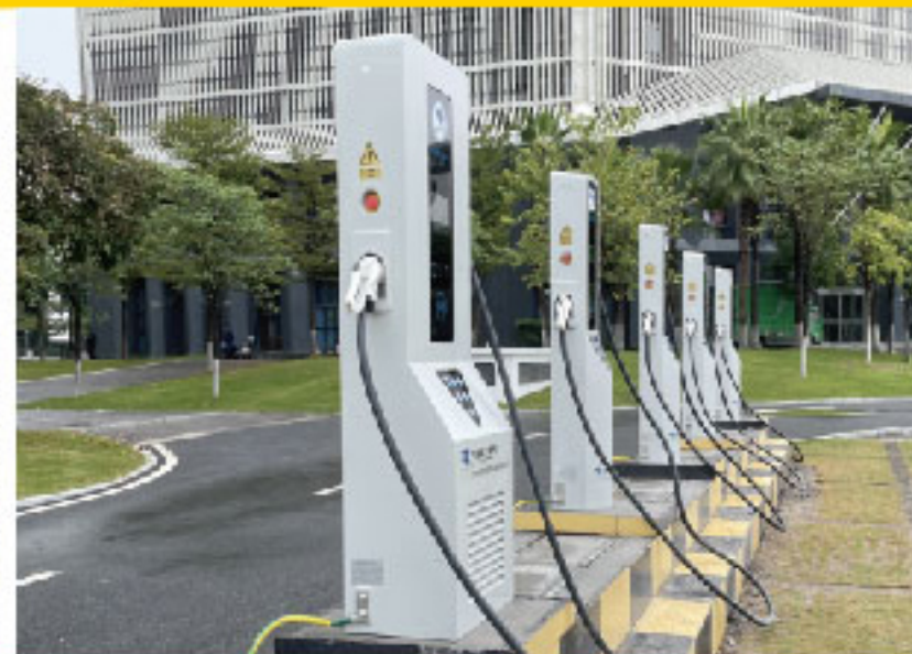
电动汽车超级充电站 EV Supercharging Station