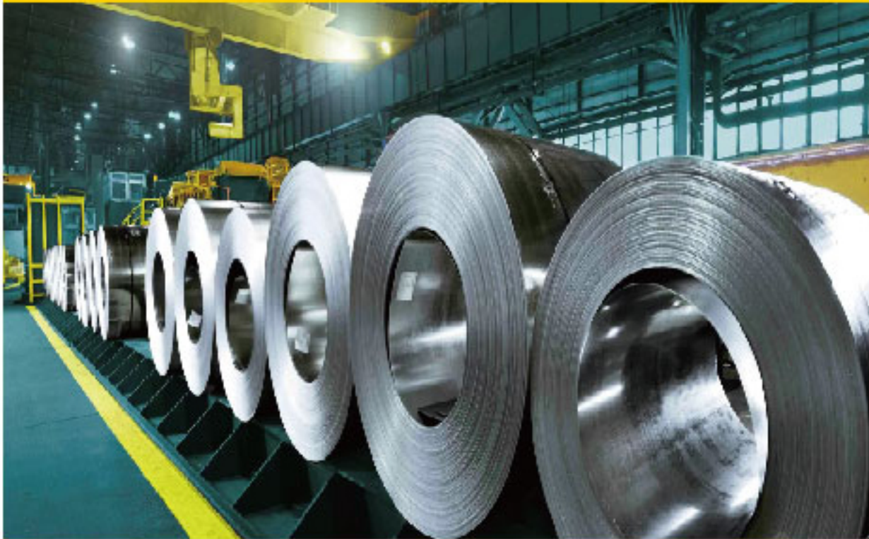
钢铁厂 Iron & Steel Factory