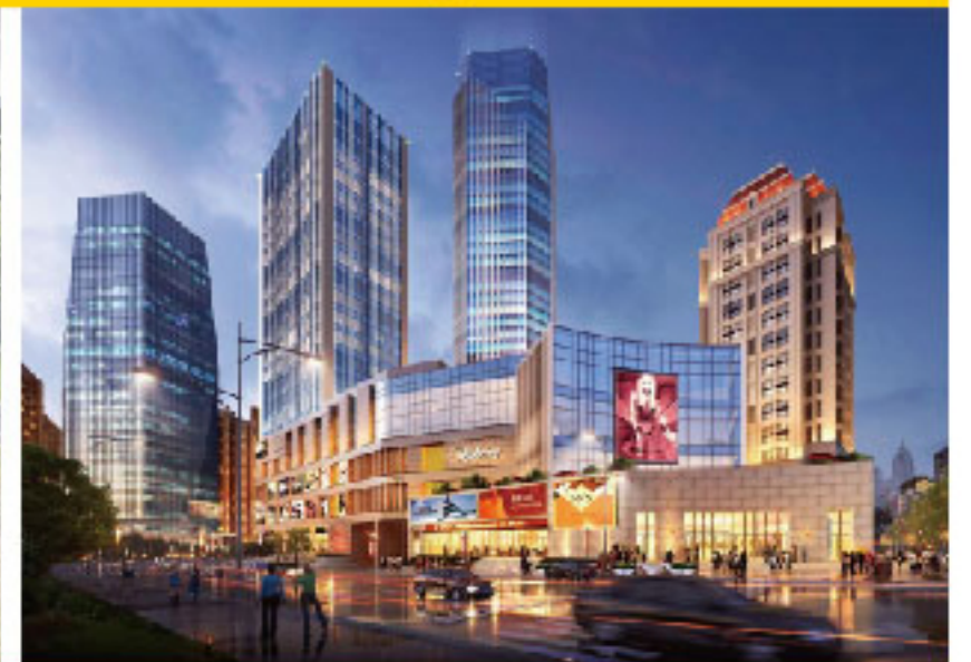
大型商业楼宇 Commercial Building Complex