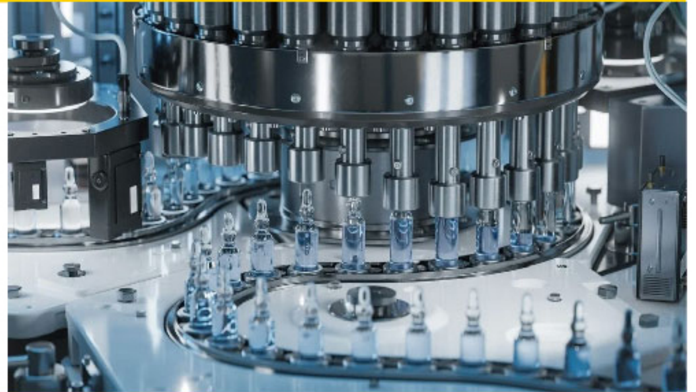
制药厂 Pharmaceutical Factory