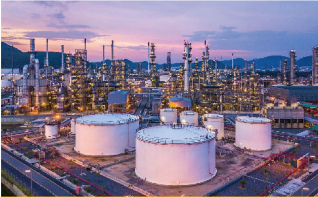
油气加工厂 Oil & Gas Refinery