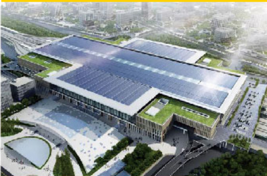
光伏屋顶火车站 Solar-Panel Rail Station