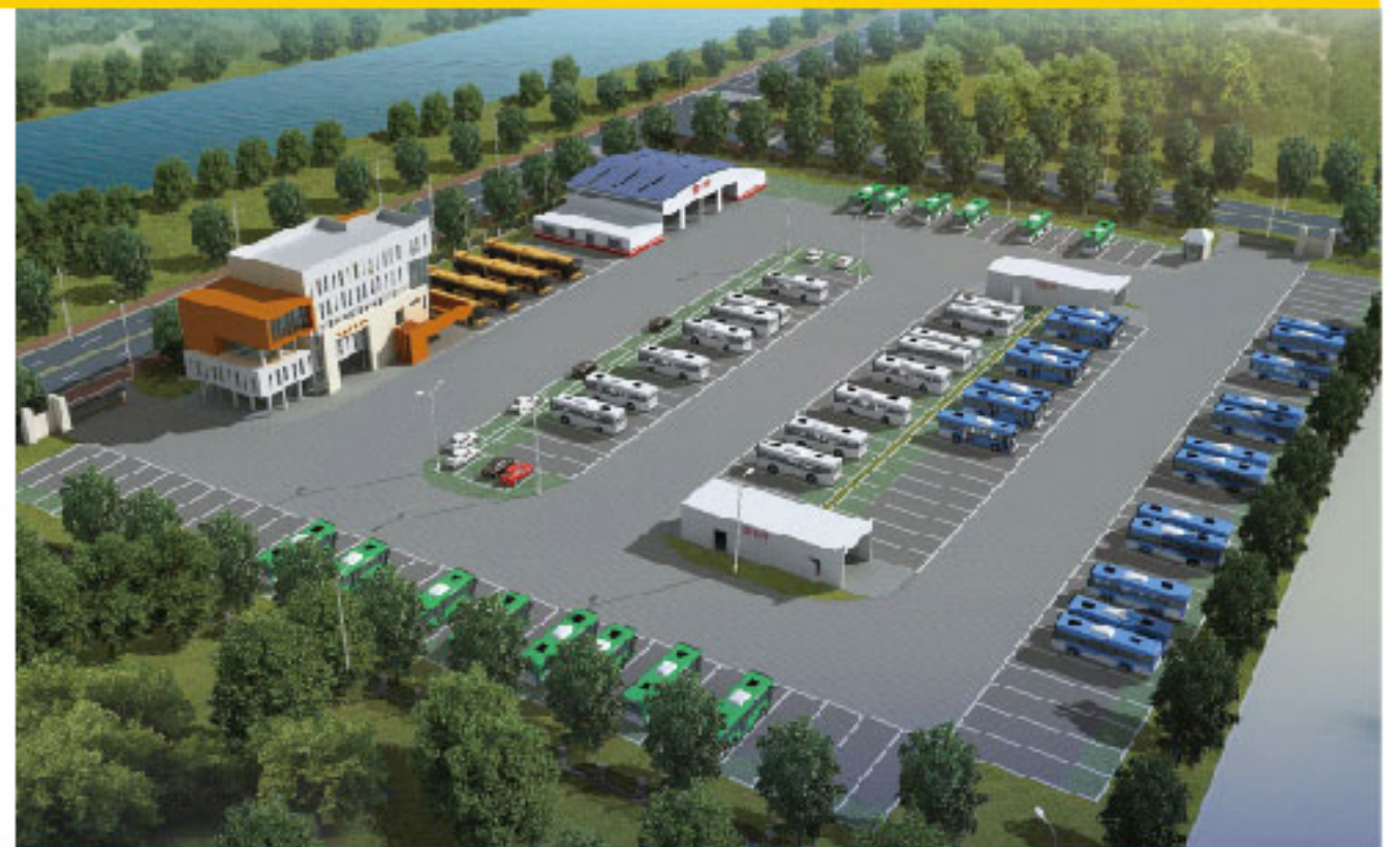
制冷中心及冷库 Cold-Chain Logistics Park