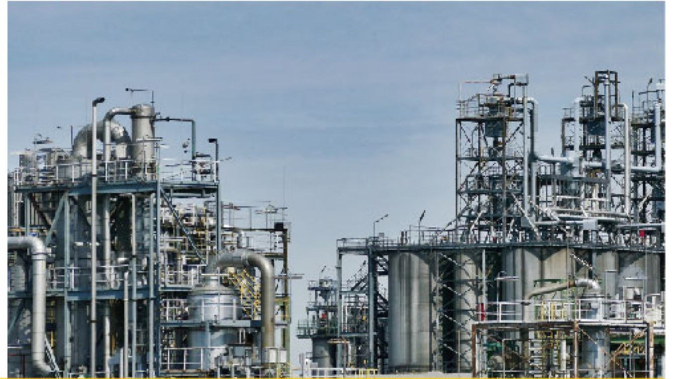
化工厂 Chemical Plant